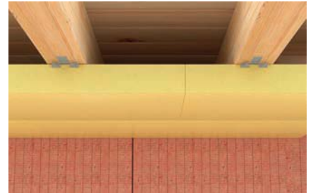
Druckfeste Dämmstoffplatten an Deckenunterseiten