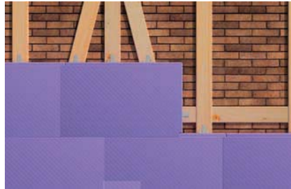
Druckfeste Dämmstoffplatten auf Holzunterkonstruktionen